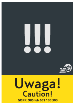
uwaga element trudny, niebezpieczeństwo /exclamation marks

1.10 PKL wprowadza w celach informacyjnych oraz dla zachowania bezpieczeństwa poniższe oznaczenia elementów tras rowerowych: