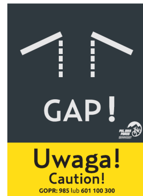
uwaga przeskok drop, gap jum