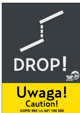
drop, uskok terenu drop, drop in