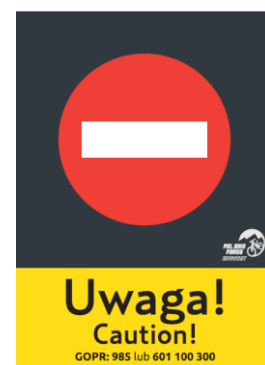
zakaz wjazdu no entry